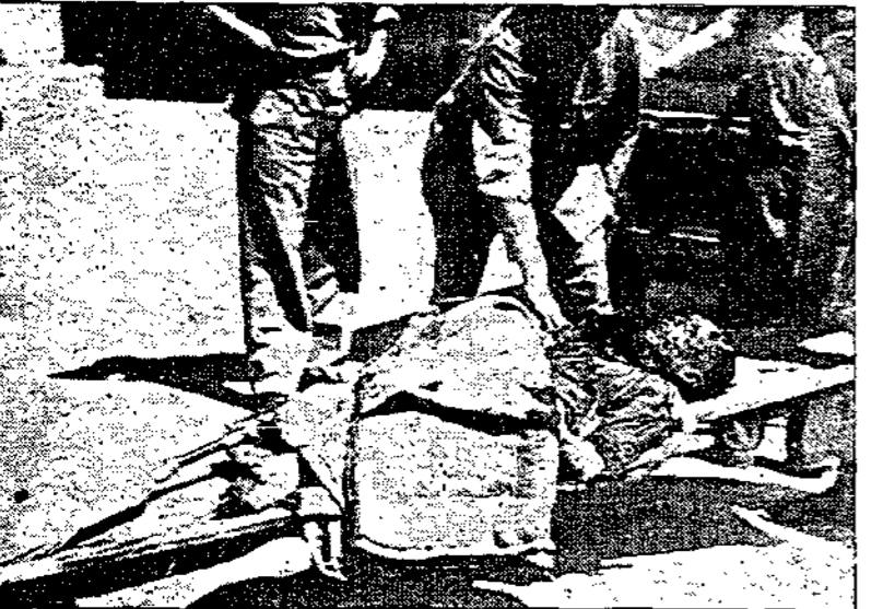
اشلاء جثمان شهيد قتل بالقنبلة الانكليزية باب الحرم الشريف بالقاهرة عند خروجه من صلاة الجمعة بالمسجد الاقصى رحمة الله