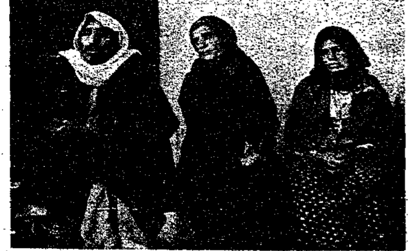
فريق من أهل القرى بعد أن ضربهم الجنود وساقوهم إلى إدارة الشرطة