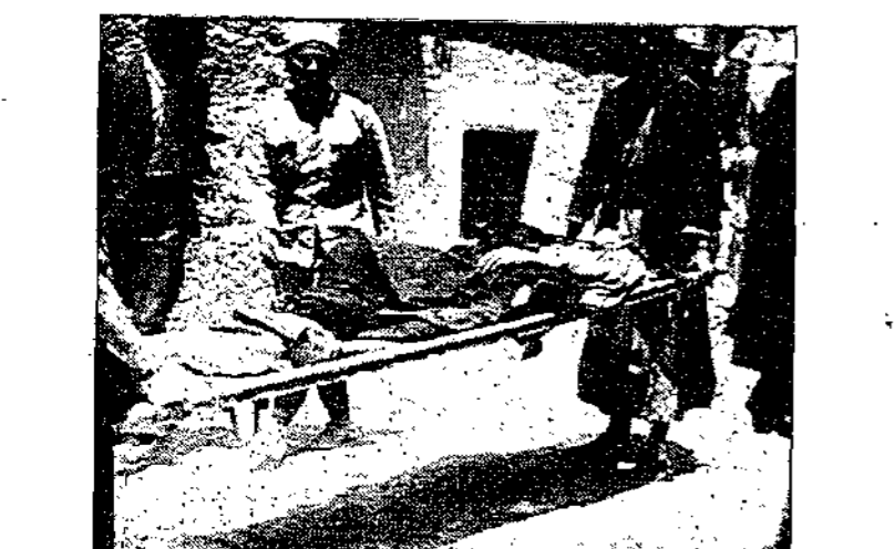
اشلاء شهيد قتل عند باب الحرم الشريف عند خروجه من صلاة الجمعة في المسجد الاقصى بالقاهرة وكان قلبه بشظايا قنبلة وضها الجنود الانكليز عند باب الحرم الشريف وضجروا وهاجروا خروج المسلمين من الحرم