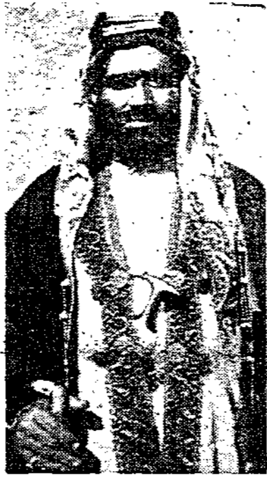
صورة امين امير الامير سلطان بن صقر القاسمي امير الشارقة وتواضعها بخارج فارس نشرها بمناسبة تبرعه لتسكوي فلسطين للمرة الثانية