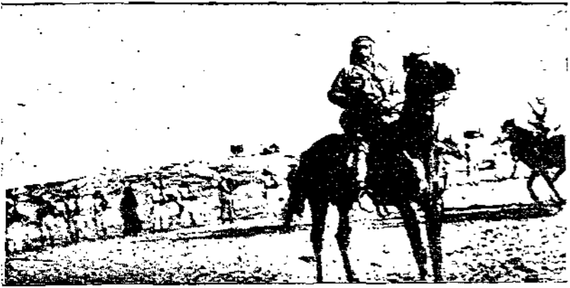
صورة البطل المجاهد السيد عارف عبدالرازق احد كبار قواد ثورة فلسطين رايكيا على جواده وقد ظهر خلقه عدد من المجاهدين المشاة

القاهرة في يوم الاربعاء ٢ رمضان المظلم سنة ١٣٥٧