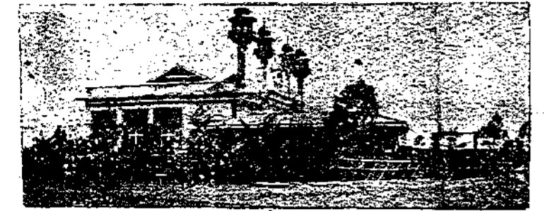
الجانب الشمالي من مسجد مدينة نيروني الجديد بشرق افرقية وتظهر مناراته الاربع بجهاظ وزخرفها والهدية تحيط به . وقد أهدانا الصورتين السيد شاهر عبد الرحمن العريفي تزيل بوسيو بشرق افرقية