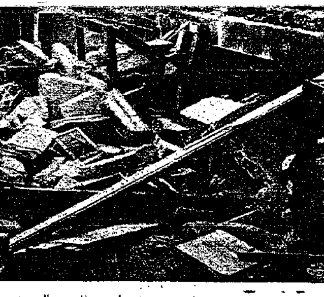
فوق هذا الكلام منظر جانب من قهوة فاروق بالقدس الشريف بعد ان قذبت عليها اليهود قنبلة فخاكة يوم ٢٩ يونيو سنة ١٩٣٩ فهدمت وحطمت ونفكت بالا برياء تقنيا وجرحا ولم يقبض الانكليز على أحد من اليهود ولا قاتلهم بشيء، ورحم الله الشهداء

(١) موضع كثير الاسد في بلاد العرب (٢) الشمس