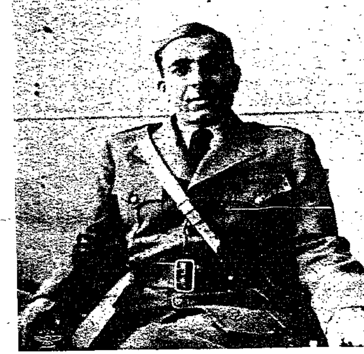
عريف عبد الزازق