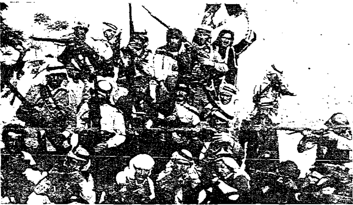
منظر فريق من مجاهدي فلسطين يحملون علمهم وهم على أبهة الهجوم على الاعداء